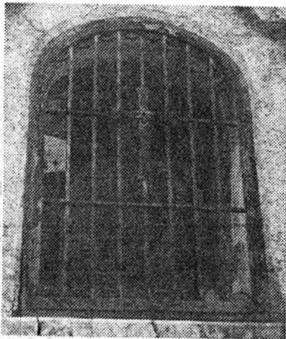
Sektor V, Bildstöcklein in der Kleinen Stöckenmauer. 2. Epoche 1757-64. Renoviert 1855 und 1930.

Ein stummer Zeuge – die Stöckemauer – beginnt zu sprechen!